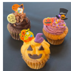
ハロウィンカップケーキ 1個 ¥350 (3個 ¥1,000)

• ケーキはお持ち帰りもできます。• 季節により種類が変更になります。詳しくはスタッフにお尋ねください。