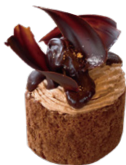
チョコレートケーキ ¥380