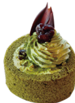
抹茶ロールケーキ ¥400