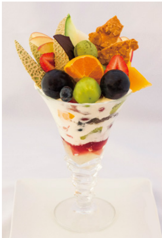
スペシャルフルーツパフェ ¥1,580