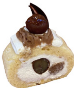
栗の和三盆ロール ¥400