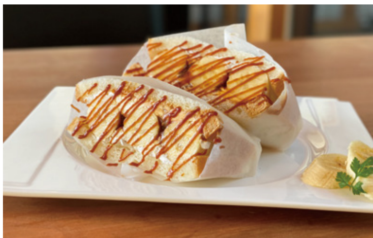
バナナキャラメルサンド ¥650