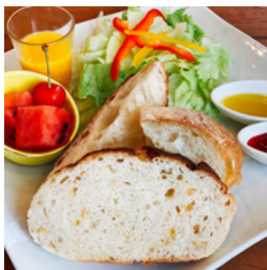
こだわりパンセット ¥700