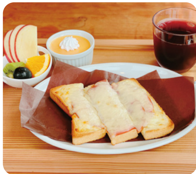
ハムチーズトースト ¥600