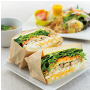
てりやきサンドセット ¥1,280