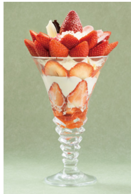
スペシャルイチゴパフェ ¥1800