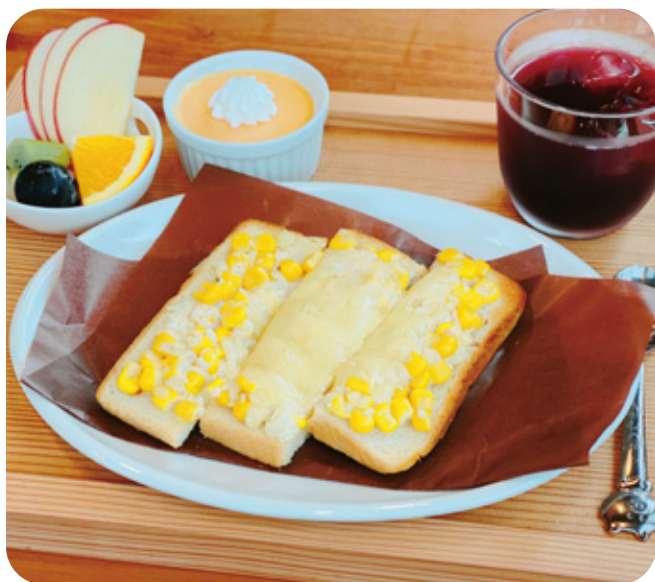
コーンチーズトースト ¥600