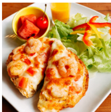
海老チーズトースト ¥800