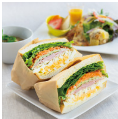
ハムサンドセット ¥1,280