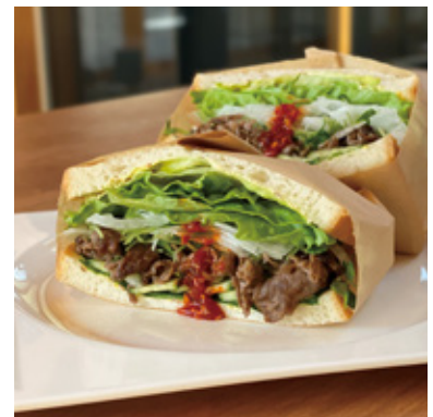
熊野牛サンドセット ¥1,480