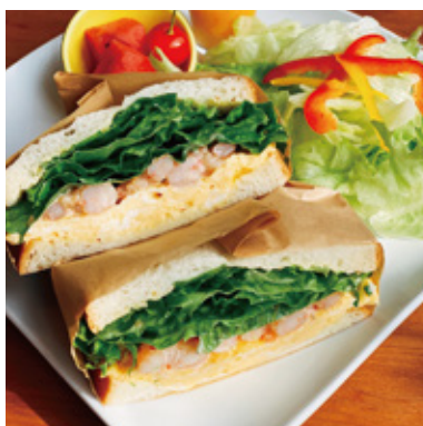
海老たまごサンド ¥700