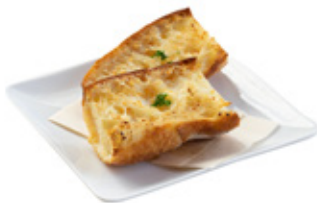
ガーリックフランス ¥1,380