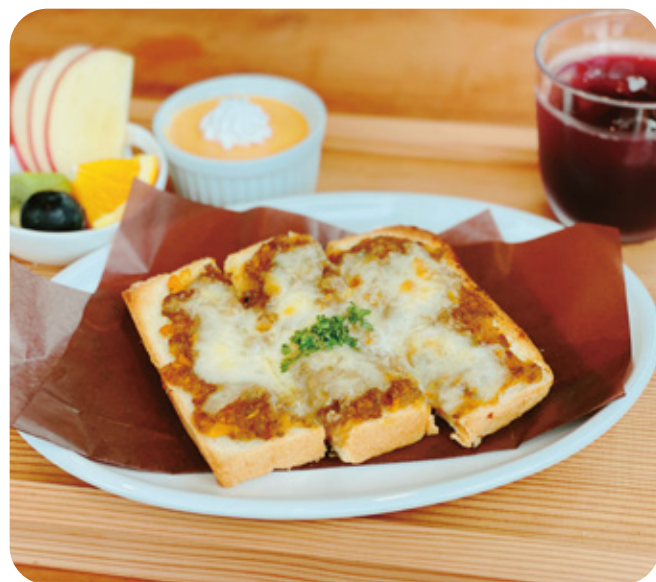
カレーチーズトースト ¥600