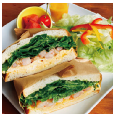
海老たまごサンド ¥900