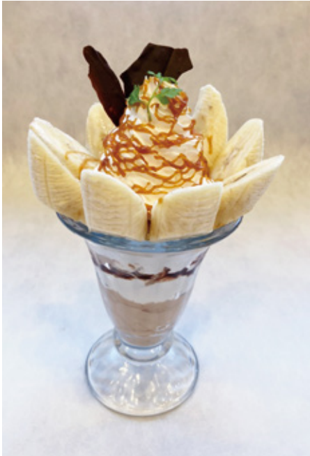
キャラメルバナナパフェ ¥780