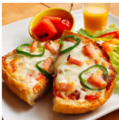
フレッシュトマトのピザ風トースト ¥800