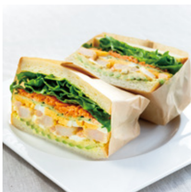
海老とアボカドのサンド ¥750