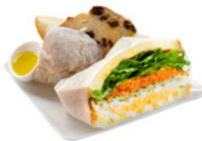
たまごハムサンド ¥1,500

ハードパンが召しあがれない方用にサンドをご用意しております。詳しくはスタッフにお尋ねください。