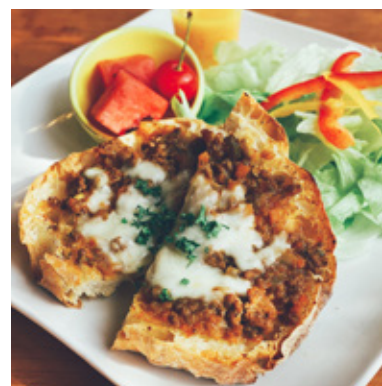
カレーチーズトースト ¥800