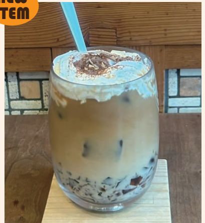
COFFEE JELLY LATTE