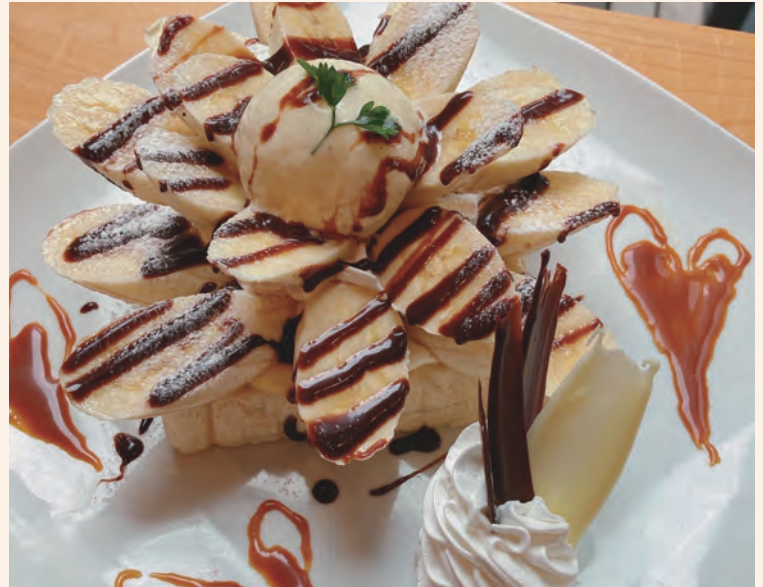
バナナたっぷりトースト 1,200 (税込 ¥1,320)

ふわふわもちりトーストパンにマスカルポーネとはちみつが隠し味！たっぷりいちごとバニラアイスクリームがお口にとろけます