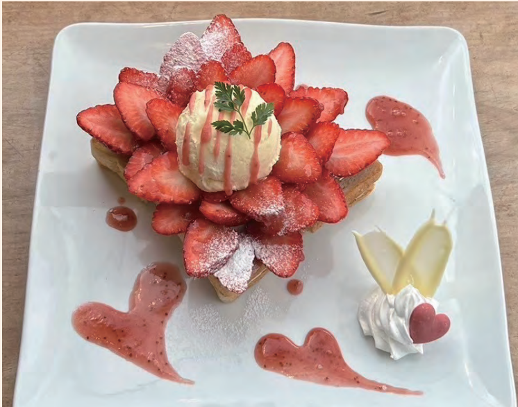
まりひめいちごトースト 2,000 (税込 ¥2,200)

ふわふわもちりトーストパンにマスカルポーネとはちみつが隠し味！たっぷりいちごとバニラアイスクリームがお口にとろけます