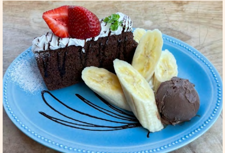
バナナ&チョコ 630 (税込 ¥693)

しっとりふわふわシフォンケーキにホイップクリームをサンド「当店イチ押し！」季節のフルーツをたっぷりと使用しています