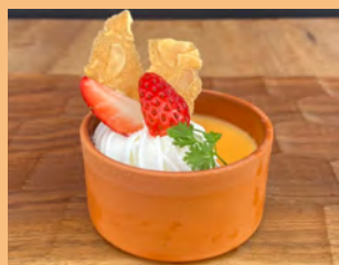
カスタードプリン