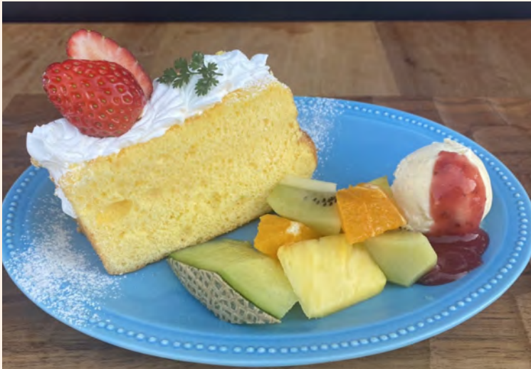
フルーツミックス 630 (税込 ¥693)

しっとりふわふわシフォンケーキにホイップクリームをサンド「当店イチ押し！」季節のフルーツをたっぷりと使用しています