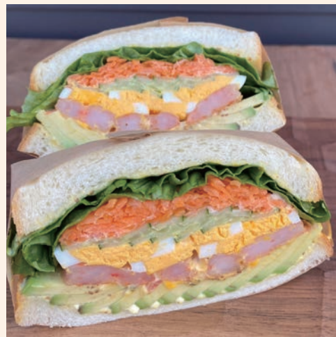
海老アボカドサンド 980 (税込 ¥1,058)