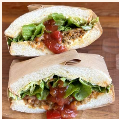
タコス風サンド 930 (税込 ¥1,004)