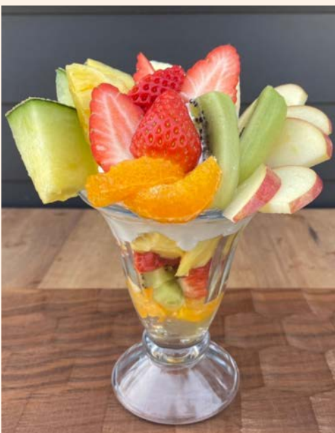
フルーツパフェ 1,200 (税込 ¥1,320)

パフェ人気 No.1 季節のフルーツをたっぷり使い バニラビーンズ入りバニラアイスがアクセント