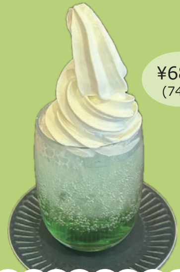
メロンソーダフロート