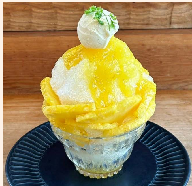
パイナップル 1,300 (税込 ¥1,430)

5種類のフルーツを使用した懐かしい味 のミックスジュースをかき氷にしました バニラとミックスフルーツの相性抜群！