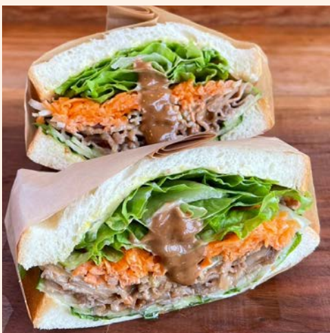
和歌山の梅豚サンド 980 (税込 ¥1,058)