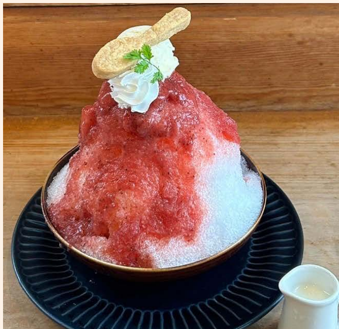
いちごかき氷 1,200 (税込 ¥1,320)

当店の一番人気のかき氷 おいしい時期のいちごをたっぷり使った 果肉がごろごろの手作りいちごシロップ 練乳をお好みで・・・