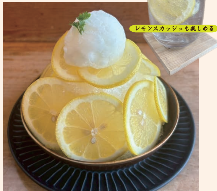
レモンかき氷 1,200 (税込 ¥1,320)

当店の一番人気のかき氷 おいしい時期のいちごをたっぷり使った 果肉がごろごろの手作りいちごシロップ 練乳をお好みで・・・