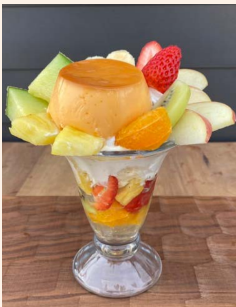
プリンパフェ 1,200 (税込 ¥1,320)

パフェ人気 No.1 季節のフルーツをたっぷり使い バニラビーンズ入りバニラアイスがアクセント