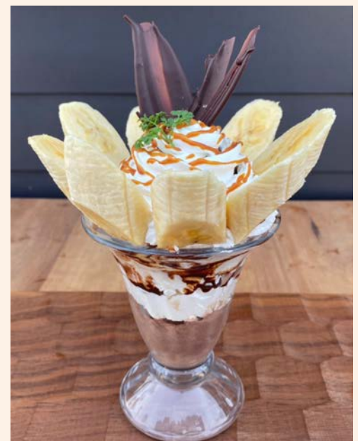
キャラメルバナナパフェ 850 (税込 ¥935)

自家製こだわりのたまごのカスタードプリン 季節のフルーツをたっぷりと使いました ボリューム満点パフェです