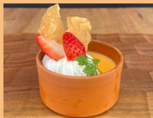
カスタードプリン