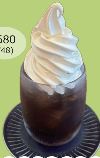
コーヒーフロート