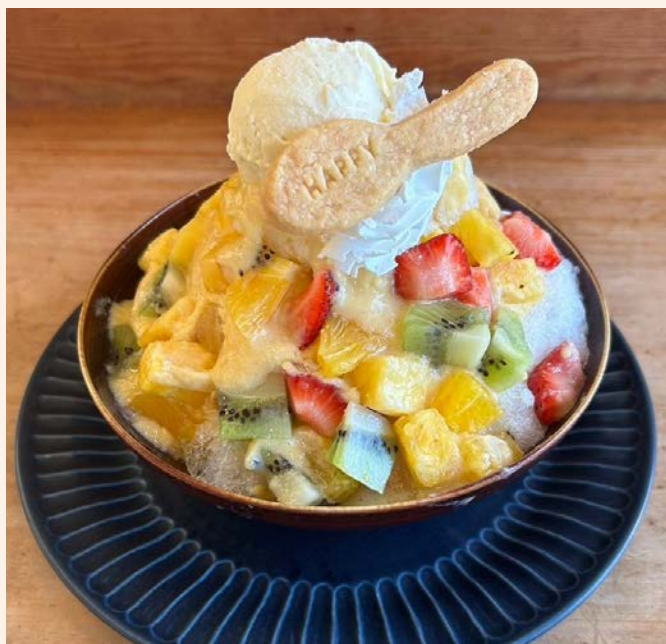
ミックスかき氷 1,300 (税込 ¥1,430)

国産レモンスライスを漬け込んで作ったシロップ と手作りレモンジャムをたっぷりかけた爽やかな かき氷にレモンシャーベットをのせました お好みでハチミツをかけてシロップ漬けレモンスラ イスをセットの炭酸水に入れてお召し上がりください