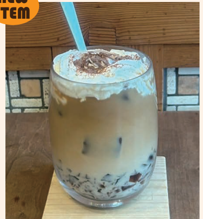
COFFEE JELLY LATTE