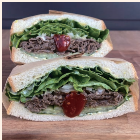
霧峰牛サンド 1,110 (税込 ¥1,198)