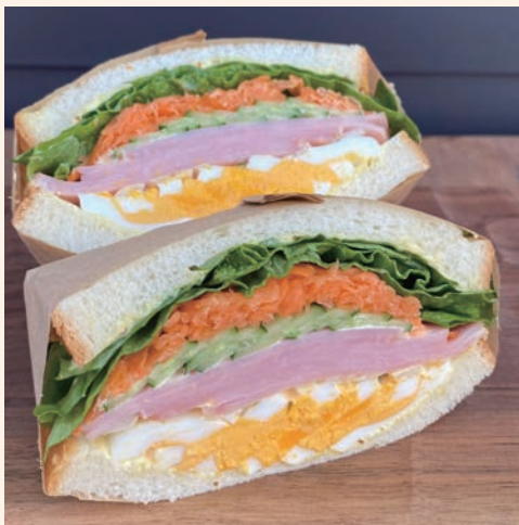
ハムサンド 930 (税込 ¥1,004)