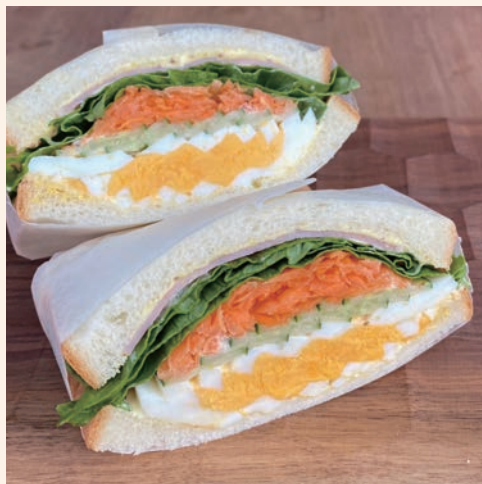
野菜たまごサンド 780 (税込 ¥842)

ご注文お受けしてからお作りしますので、事前にご予約いただいた方がスムーズにお渡しできます ☎0725-53-5980 / hatsuganoterrace.com / 大阪府和泉市はつが野 3-1